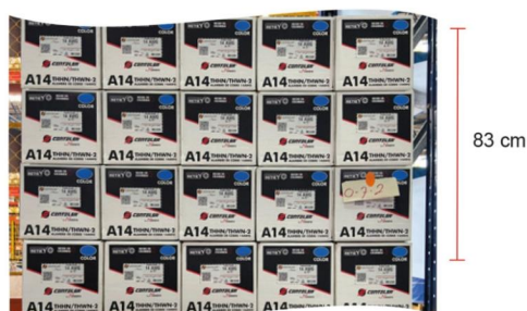
Alturas de estiba. Alambre 14 THHN AWG Mobiiway™ POP