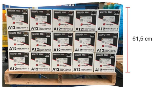
Alturas de estiba. Alambre 12 THHN AWG Mobiiway™ POP