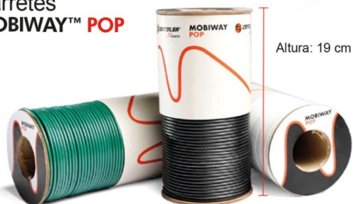
Carretes MOBIWAY™ POP